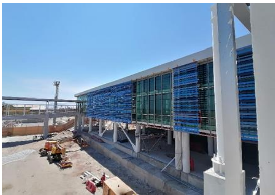
Trabajos de Terminaciones en 1° Nivel Edificio Terminal de Pasajeros (Ampliación)