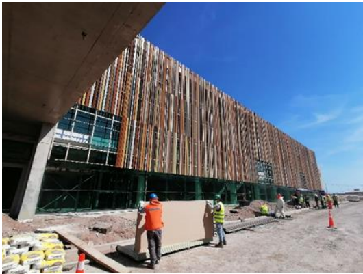
Instalación Estructura Metálica y Celosías, Fachada Oriente Ed. Terminal de Pasajeros

A la fecha, y en base a lo indicado en el punto anterior, la SC durante este periodo ha procedido con el avance de obras, las cuales se presentan en el siguiente registro fotográfico: